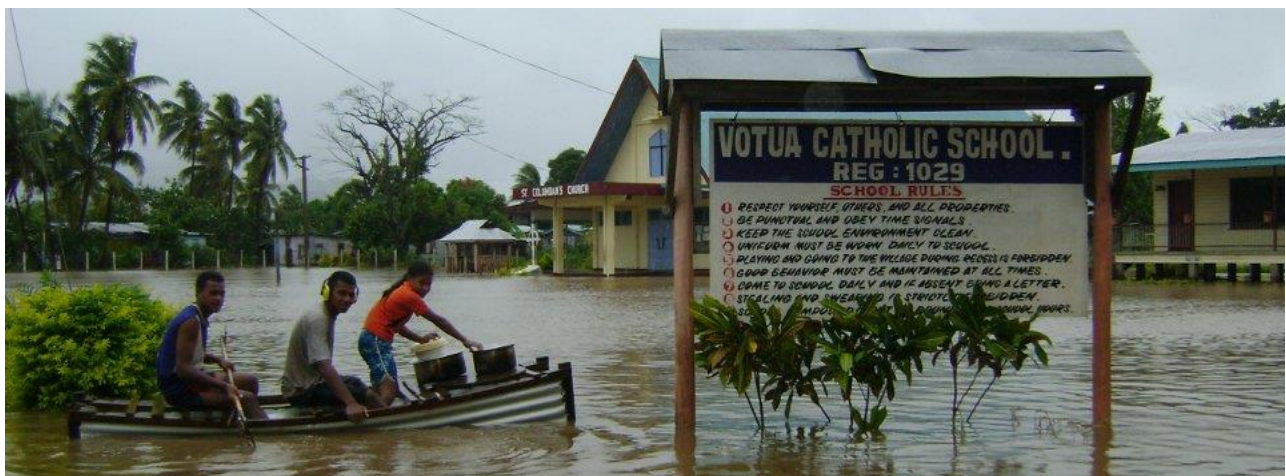
iTaba 1. Waluvu e Votua(iTaba): Rokovi na lewei Votua)