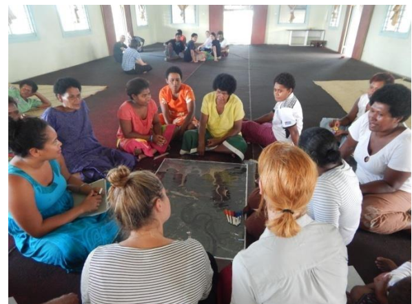
iTaba 2. Participants of a participatory mapping session in Nawaqarua, tikin O Ba (iTaba: A. Neef)

E a qaravi ena loma ni macawa rua na vakasokumuni itukutuku qo. E na gauna ni vakadidike qo, a qaravi kina na vuli vei ira na lewe ni vanua kei na vakadidike vaka yadudua ena lomanivanua o Navala kei Votua. Na itukutuku e a vakasokumuni mai na veitarotarogi, ivola vakarautaki kei na mape ni nodra vakaitavi na lewe ni vanua. Na talanoa ena iwalewale ni soli itukutuku vaka Pasivika e kabasi taka na na iwalewale kece e vakayagataki me vakasokumuni kina I tukutuku I walewale