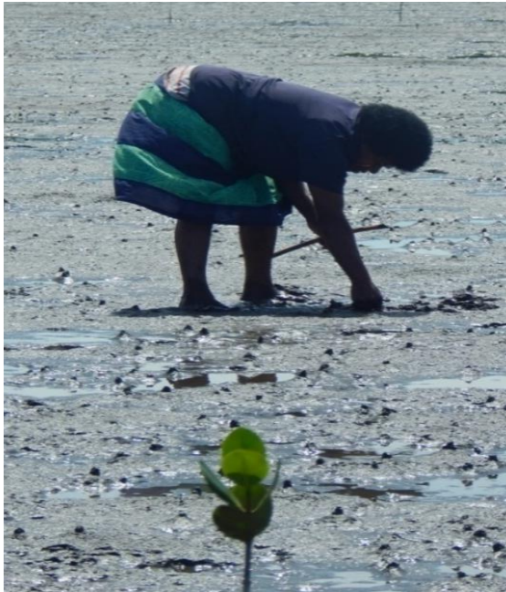
iTaba 4. E keli kaikoso tiko na marama qo ena uciwai na Ba

Na vakaleqai rawarawa e tiko ena itikotiko vaka iTaukei. E vuqa na lewe ni vanua era vakaraitaka ni ra dau vakaleqai vakalevu o ira na malumalumu, o ira e vakaleqai tu na ituvaki ni yagodra, ka vaka kina o ira e vakacacani na nodra vale, o ira oqo era gadreva tu na veivuke ena gauna ni leqa tubukoso. Na kena oqo e vakaraitaki tiko ena Kato 3.